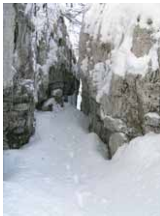
Risi se radi gibljejo po skalnatem in zelo razčlenjenem površju, kakršnega v dinarskem svetu ne manjka.

Pot nadaljujem prečno po pobočju in pozneje pridem do zasnežene ceste. Nekoliko na-