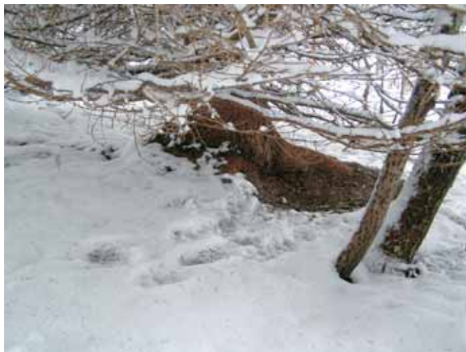
Ris si je za počitek izbral zakrito mesto pod smreko.

prej opazim, da se je ris s ceste zapodil za poljskim zajcem. S trimetrskimi skoki se je pognal navzgor po pobočju, kamor jo je ucvril zajec. Očitno je bil plen le prehitel. Po 30 metrih gonje je moral odnehati. Vidim, da se je usedel in si privoščil počitek po utrujajočem sprintu v hrib, potem pa ponovno nadaljeval pot v hoji. Pozneje se je povzpel še na en skalnat vrh, kjer spet opazim številne stopinje gamsov. Vendar tudi tu ris ni