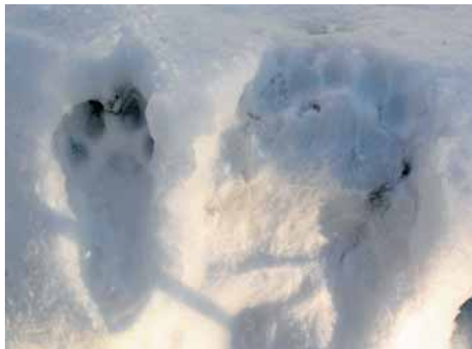
Jutranje sonce osvetli svežo sled velike mačke.