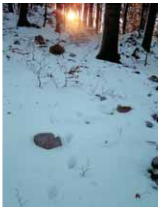
Nisem edini, ki je sledil risu. Del poti je šel za njim tudi medved, ki se je zbudil iz zimskega dremeža.

Nato me ris pripelje do markantnih skal, ki se dviga-