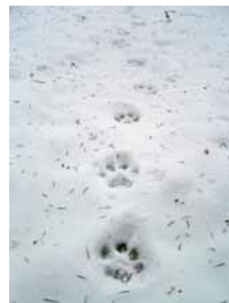
Risova sled prek Snežniške planote. S pomočjo sledenja v snegu se lahko veliko naučimo o vedenju divjadi.

kar nalašč izbira pot prek razčlenjenega, skalnatega sveta. Kot bi hotel do zadnjega izkoristiti svojo gibčnost, ki mu jo je podarila narava.