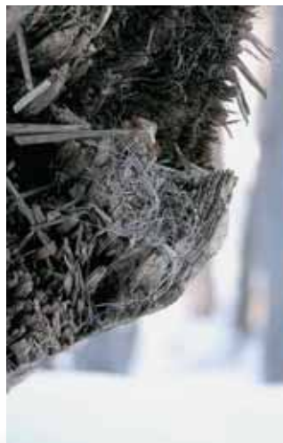
Dlaka na odlomljeni veji kaže, da se je ris podrgnil ob njo, tako kot to počno domače mačke.