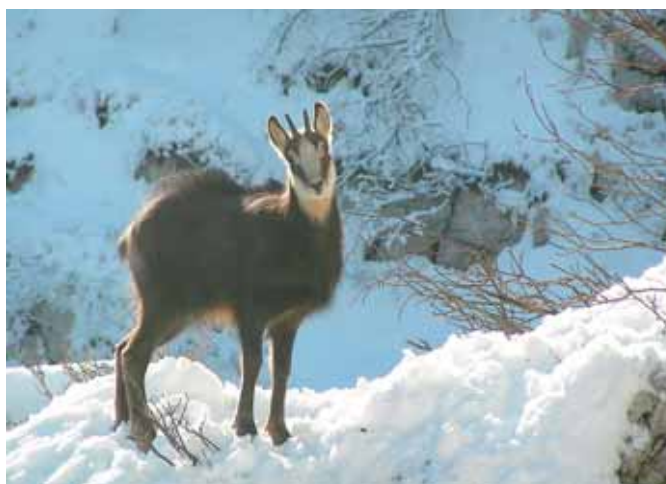
Poskus lova na gamsa je bil tokrat neuspešen.

imel sreče in počasi se je začel spuščati proti jugu v nižje ležeče predele.